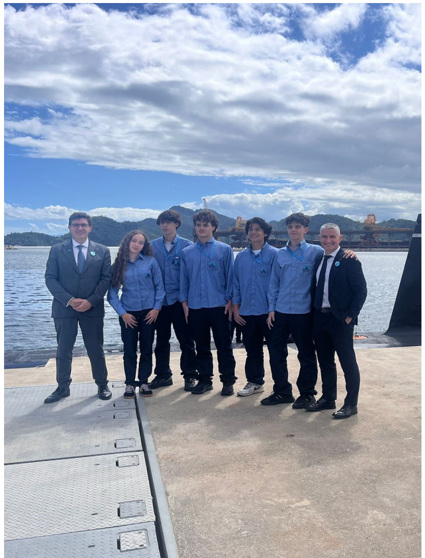
Les stages des Secondes