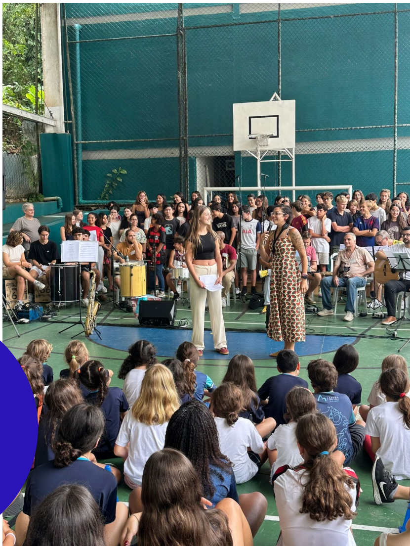
Cérémonie de clôture du Mois de la Culture Afro Brésilienne