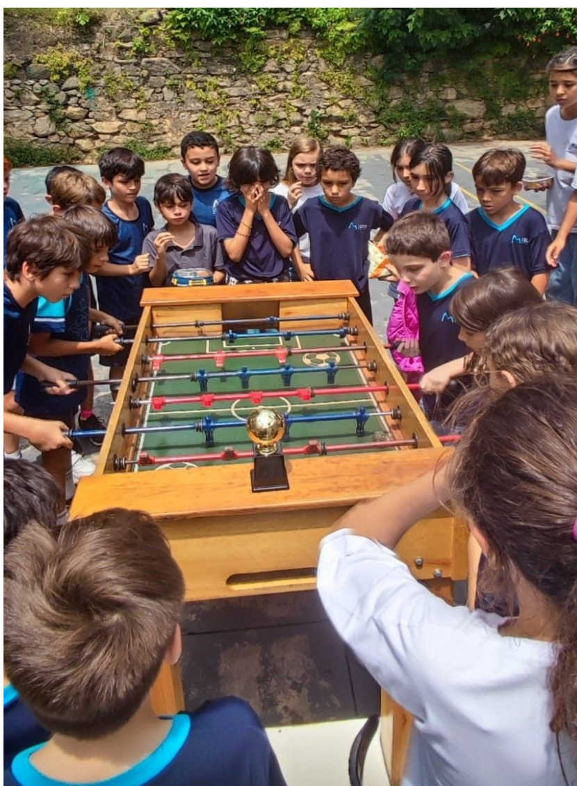
Les tournois sportifs des CE2/CM1/CM2