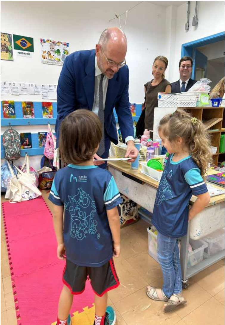
As visitas Oficiais