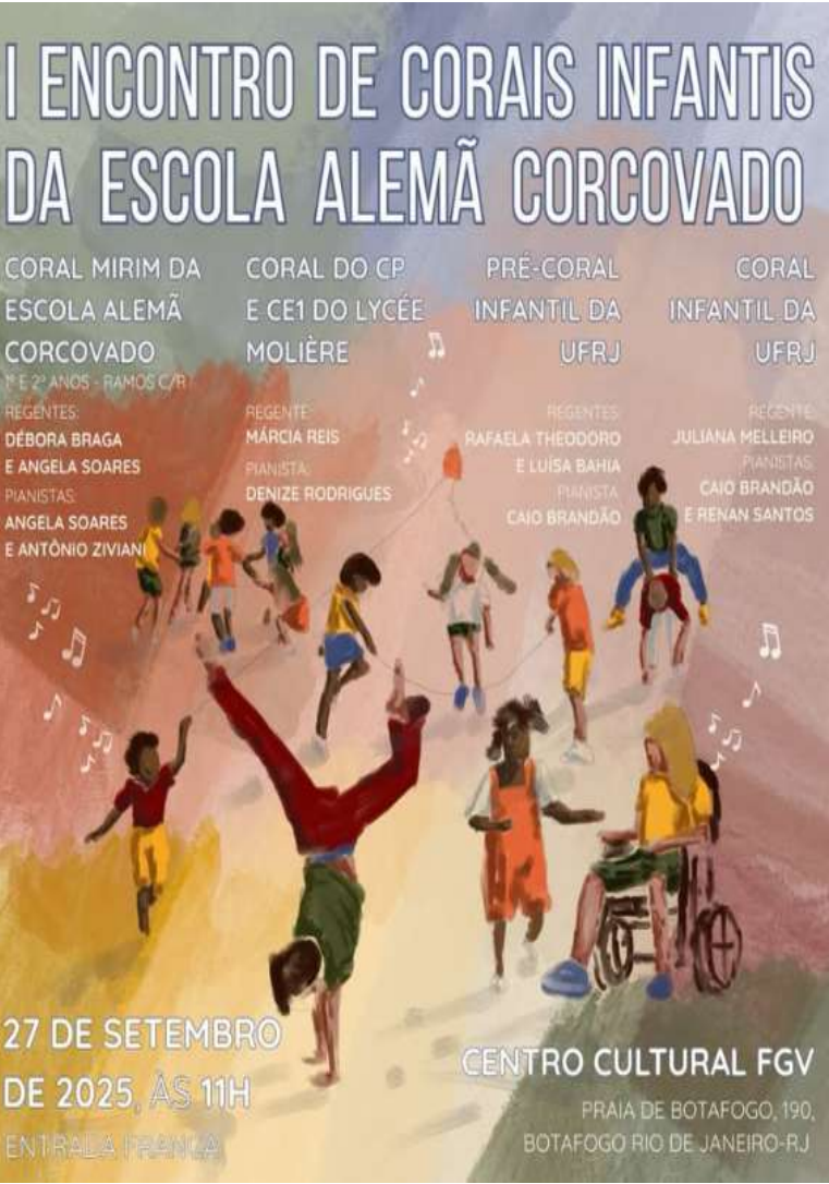
O Coral do Periscolaire