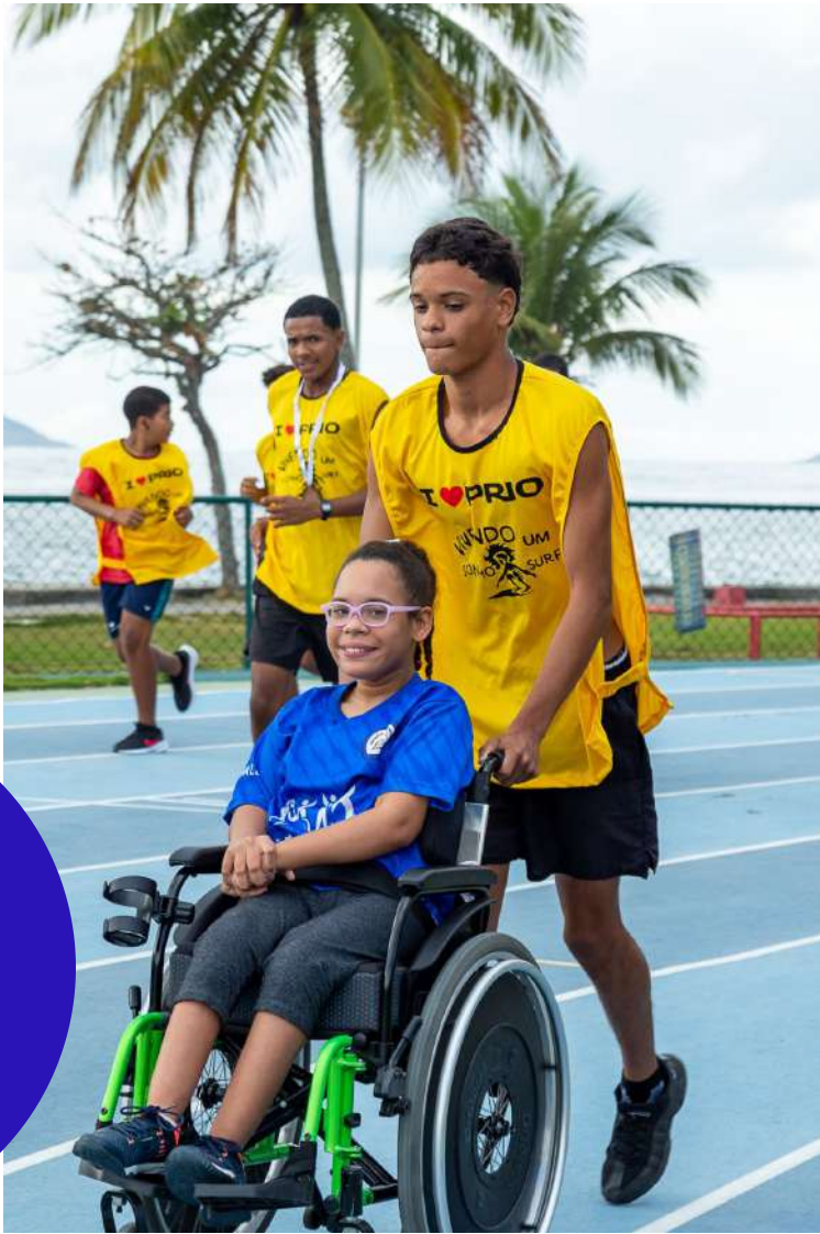
Resultados Corrida Humanitária